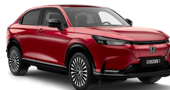
VERMILLION RED PEARL