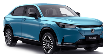
AQUA TOPAZ METALLIC

* De rijkslaarkosten van € 1.150,- omvatten laadkabels (mobiele thuislader P-EVSE & G2G, Type-2, 3-fase), poetsen, afleveringscontrole, kentekenplaten, ruitenwisserolie, handling (transport, gevarendriehoek, veiligheidsvest), ontvetten, recyclingbijdrage en leges (kosten tenaamstelling en kosten aanvraag kenteken)